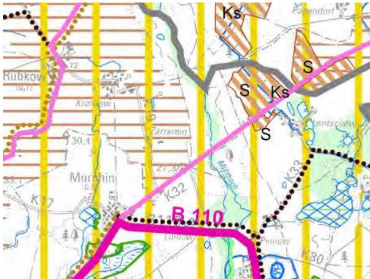
Abb. 2: Auszug aus dem Regionalen Raumentwicklungsprogramm Vorpommern

Das Plangebiet liegt in einem Entwicklungsraum für den Tourismus.